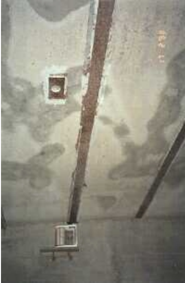
Bild 4: Probestück nach der Haftzugprüfung an der abgesandeten Lamelle.

unweigerlich ein Risiko für die Tragfähigkeit dar. Um den großen Aufwand, der mit dem Entfernen einer fest verklebten Lamelle verbunden ist, zu vermeiden, werden die Lamellen zusätzlich sofort nach der Applikation abgeklopft, da sie dann noch sehr einfach zu entfernen und zu erneuern sind. Sollte eine Lamelle als nicht tragfähig eingestuft werden, wird man sie in den meisten Fällen nicht entfernen, sondern eine weitere daneben kleben. Wie in Bild 5 zu sehen, sind auch Lamellenkreuzungen unproblematisch auszuführen. Dies wäre mit Stahllamellen nicht möglich.